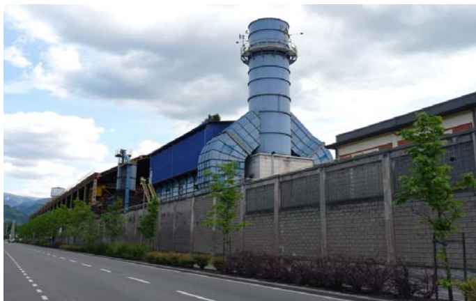
Abb. 2: Industriezone Bozen/Südtirol.

WP 7: Abschließend werden die Leistungen und Ergebnisse der Phasen WP5 und 6 systematisch ausgewertet. Die abgestimmte Betriebsansiedlungsstrategie wird der Beurteilung, den Erfahrungen und Empfehlungen entsprechend angepasst. Damit werden die Grundlagen für das Wissensmanagement vervollständigt.